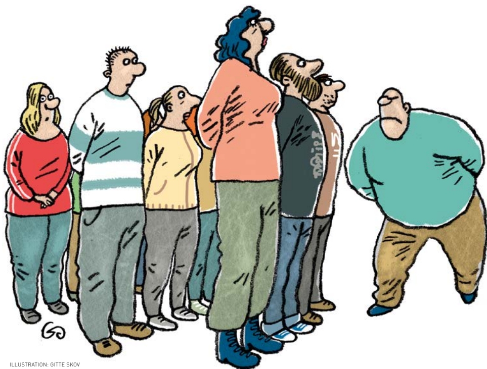
ILLUSTRATION: GITTE SKOV