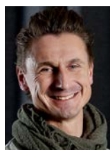
Af Michel Kikkenborg, FTR