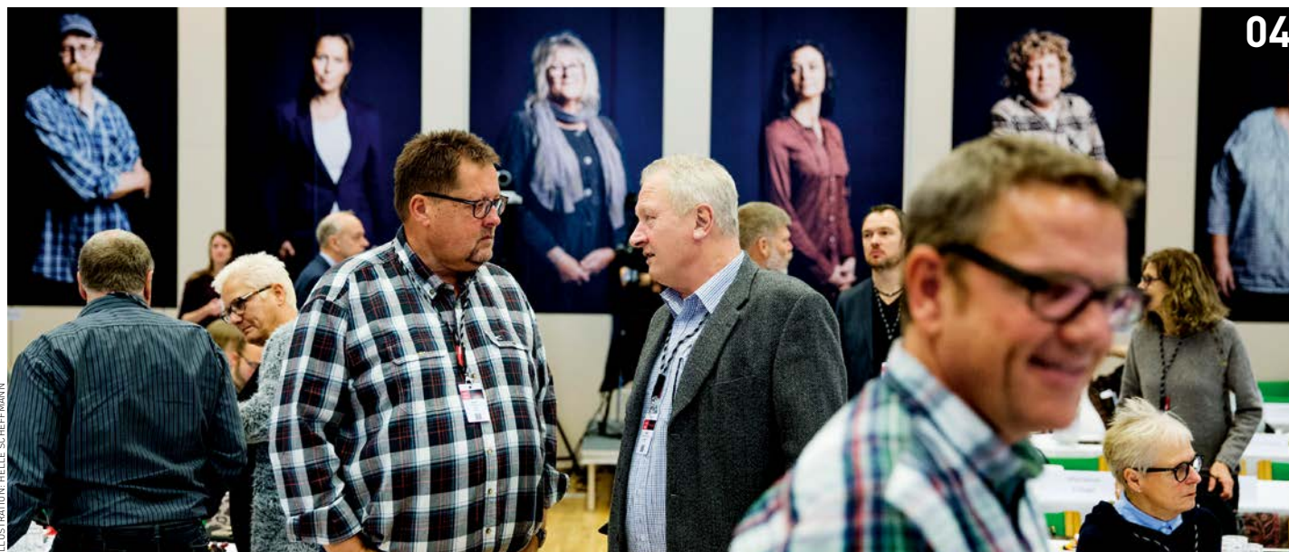
ILLUSTRATION: HELLE SCHEFFMANN