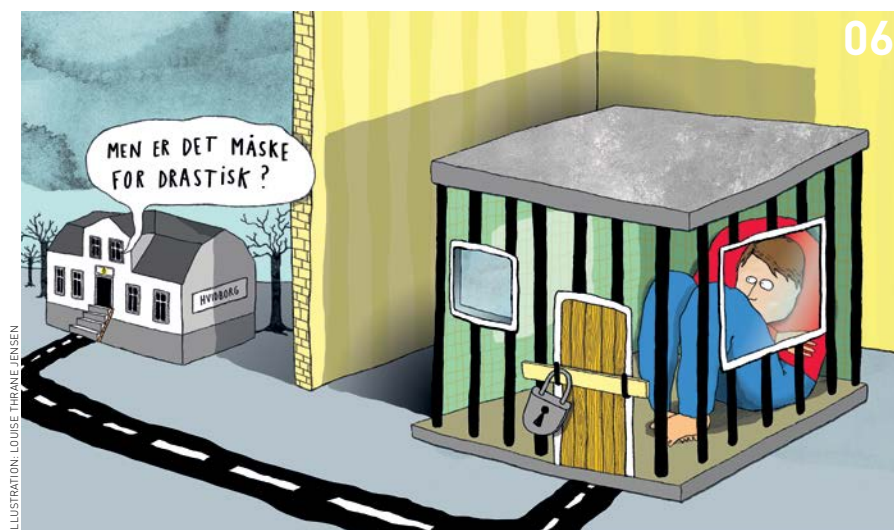
ILLUSTRATION: LOUISE THURMAGE-JENSEN