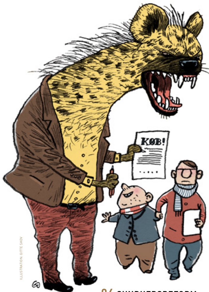
ILLUSTRATION: GITTE SKOV