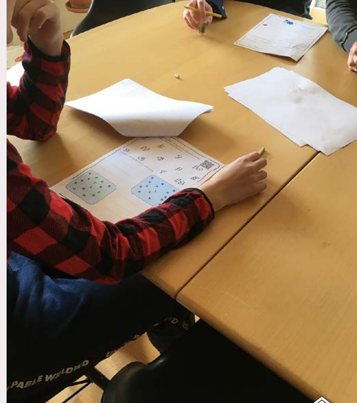
På Godhavn bliver børnene nu undervist lokalt i de enkelte afdelinger, der er isoleret fra hinanden for at holde smitterisikoen nede.

Børnenes venner uden for institutionen må ikke komme på besøg. Til gengæld er de forskellige fritidstilbud åbne, så